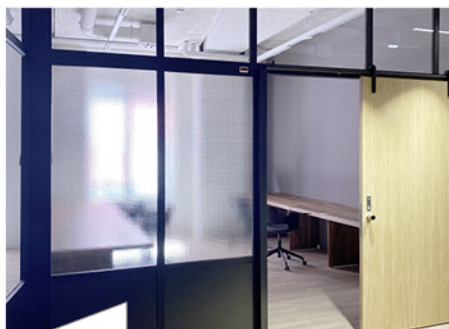
Hier die Trennwand-Lösung von Längle mit Vollholz-Schiebetüren in Verbindung mit dem Office NY System.